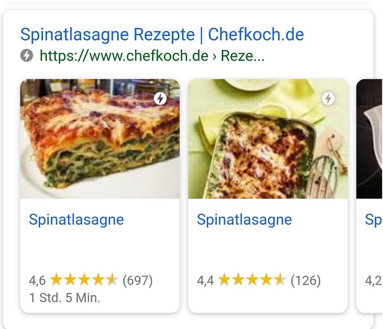
Abbildung 3: Google-Mobile-Suche nach „spinatlasagne“ mit Carousel

sieht man beispielsweise, wie Chefkoch.de seine Rezepte für „spinatlasagne“ um Bilder als strukturierte Daten angereichert hat.