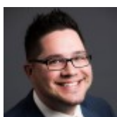
Autor: Jason Coleman

Beachten Sie, dass diese Art von Funktionalität stark von Ihrem Server-Setup abhängt und Sie möglicherweise einen Entwickler einstellen oder extra bezahlen müssen, um dies vollständig einrichten zu lassen.