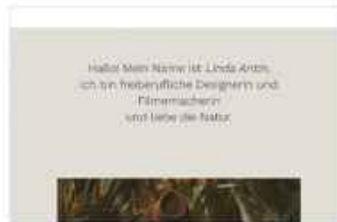
Organische Galerie mit Vorstellungstext