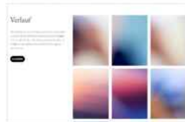
Galerie mit Beschreibung und einem Button