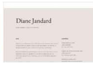
Zwei-spaltiges „Über mich“-Layout